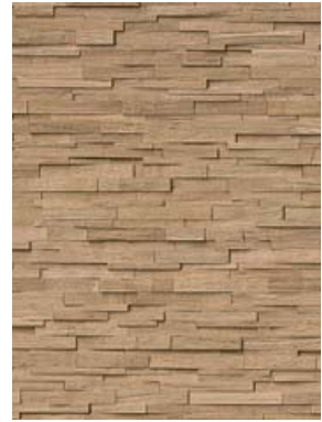
Spaltholz Eiche fein