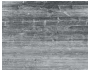
Fichte Tirol grau