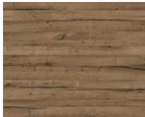
Schwarzwald Eiche dezent