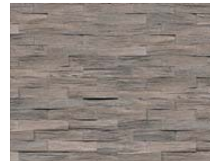
Spaltholz Eiche gealtert