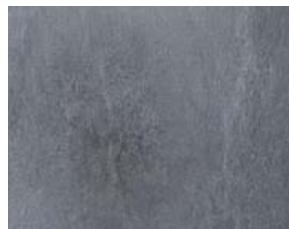
Deep Dark 3