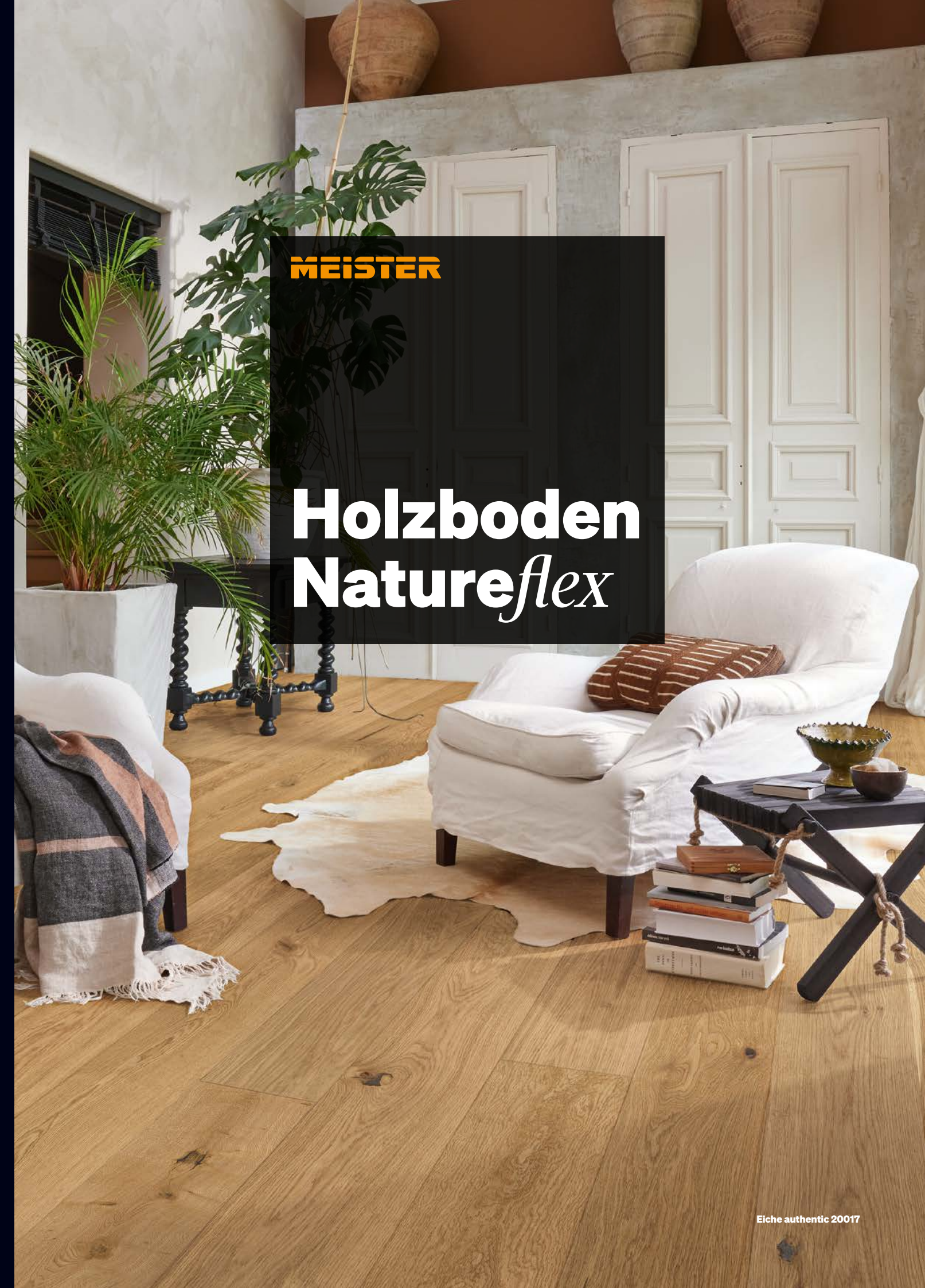
Eiche authentic 20017